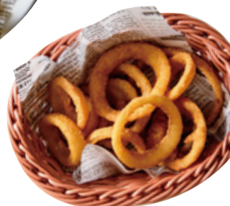
フライドオニオン