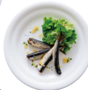
オイルサーディン