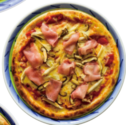
生ハムとキノコのピザ