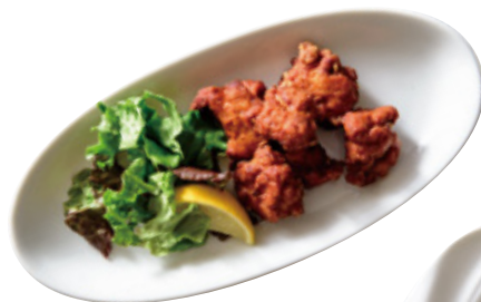
タンドリー風 から揚げ