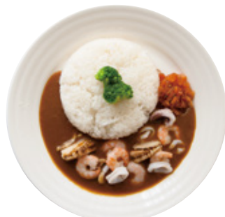
シーフードカレー