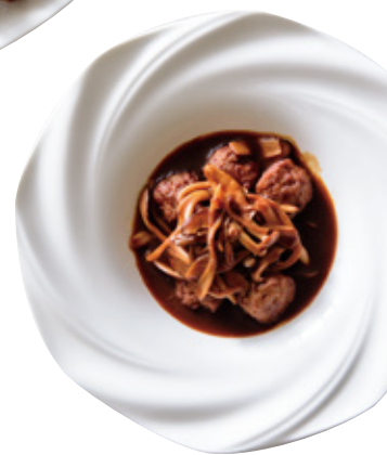
洋風ミートボール