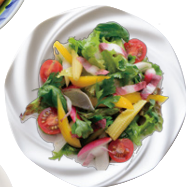
本日の彩り野菜サラダ