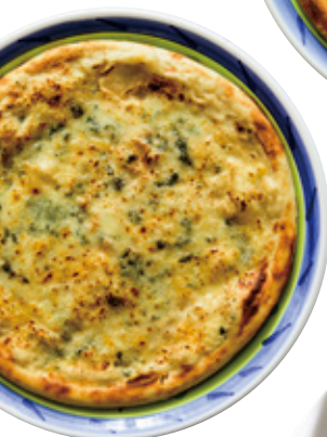
ゴルゴンゾーラのピザ