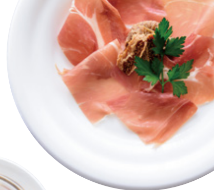
パルマ産の生ハムといちじく